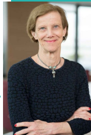
Pr Anne-Claude Crémieux